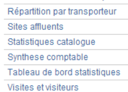
Statistiques en version 1.5