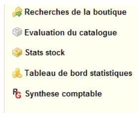
Statistiques en version 1.4

La synthèse comptable s'intègre parfaitement dans l'onglet "Statistiques" en ajoutant automatiquement un sous-menu "Synthèse comptable" dans la liste de navigation :